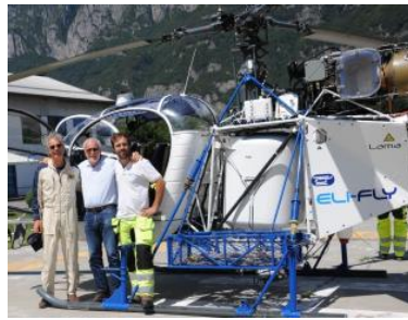
Foto di gruppo a Esine per elicottero e team cinematografico

Le riprese inizieranno nei prossimi giorni in qualche posto in Europa che per ora è ancora top secret, ma i piloti di «EliFly» hanno già potuto assaporare qualche scena. Perché la storica società elicotteristica con sede a Esine, ben conosciuta e operativamente presente in Valcamonica e non solo, è stata scelta «un po' per caso, un po'