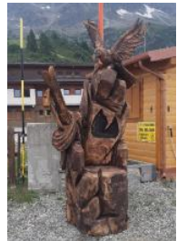
Il trono destinato al Presena

Infine, la novità più singolare del simposio: l'abbinamen-